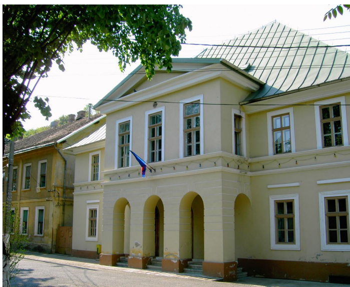
Teatrul - muzeu "Mihai Eminescu", cel mai vechi teatru din România

În oraș și în împrejurimi pot fi vizitate Farmacia - muzeu Knoblauch, Catedrala ortodoxă "Adormirea Maicii Domnului", Biserica romano-catolică, Mănăstirea ortodoxă "Călugăra", Mănăstirea catolică "Maria Ciclova".