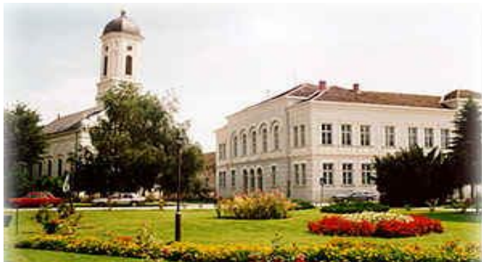
Veliko Gradište - centrul orașului

comunei se bazează pe agricultură, turism și industria de producere a uleiurilor vegetale. În structura economiei, ponderea principală o reprezintă agricultura, care este practică pe o suprafață de 22.000 ha, cultivându-se în special porumbul, grâul, plante industriale, pomi fructiferi, legume.