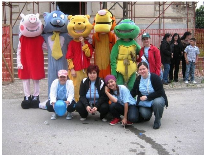
Voluntari ai GEC Nera la carnavalul de la Bela Crkva

În perioada 18.06 – 27.06.2010 a avut loc în Serbia tradiționalul Carnaval al Florilor de de la Bela Crkva (Biserica Albă), ocazie cu care în orașul de la frontiera cu România s-au desfășurat ample manifestări culturale și sportive.