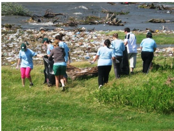
18 iunie 2010 – Baziaș. Igienizare în rezervația naturală Balta – Nera Dunăre

Proiectul a fost implementat pe teritoriul parcurilor și rezervațiilor naturale Semenec – Cheile Carașului, Cheile Nerei – Beușnița, Porțile de Fier și Deliblatska Peščara (Dunele Deliblata) din Serbia sub semnul motto-ului deja tradițional: Călătorule ai ajuns în lumea mirifică din sudul Banatului ! Nu lua cu tine decât imaginile acestei lumi și nu lăsa aici decât urmele pașilor tăi !