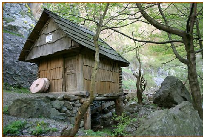
Moară de apă pe Valea Rudăriei

Ansamblul este alcătuit din 22 de mori de apă cu roată orizontală, construcții din lemn de dimensiuni reduse, utilizate pentru necesitățile de măcinare de cereale ale comunității.